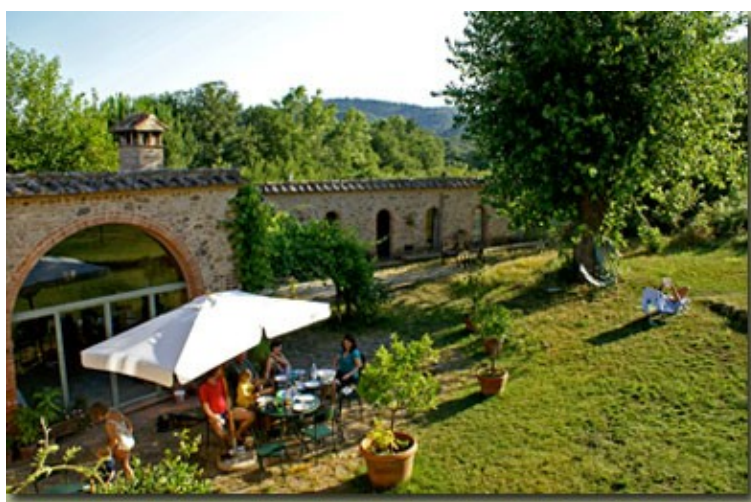
Seminarort Campalfi /Toskana www.campalfi.de